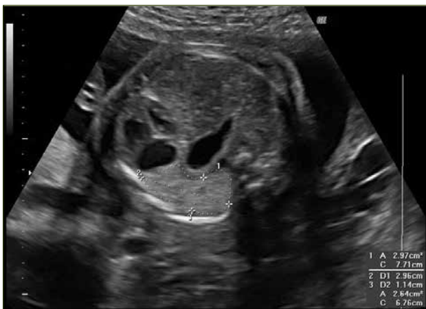
Figura 1. Hernia diafragmática izquierda en un embarazo de 26 semanas. Se puede observar el corazón en dextroposición y el estómago visible en el corte de cuatro cámaras. Además se destaca la medición del pulmón residual para el cálculo del LHR.