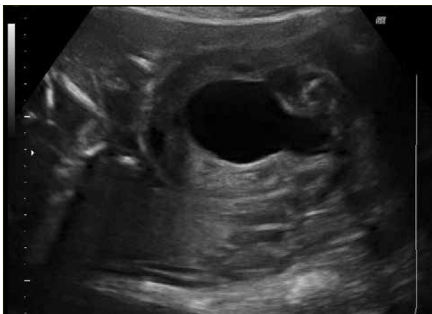
Figura 5. Signo de la cerradura.

La vesicocentesis con aspiración de orina en estos casos, permite el estudio de la orina para pruebas de función renal y solucionar temporalmente la megavejiga. Sin embargo, como tratamiento definitivo requiere de punciones repetidas, lo que lleva a un aumento del riesgo de producción de infecciones, ruptura de membranas, aborto y parto prematuro. Por lo tanto, esta intervención sólo es útil durante el período de estudio de esta patología.