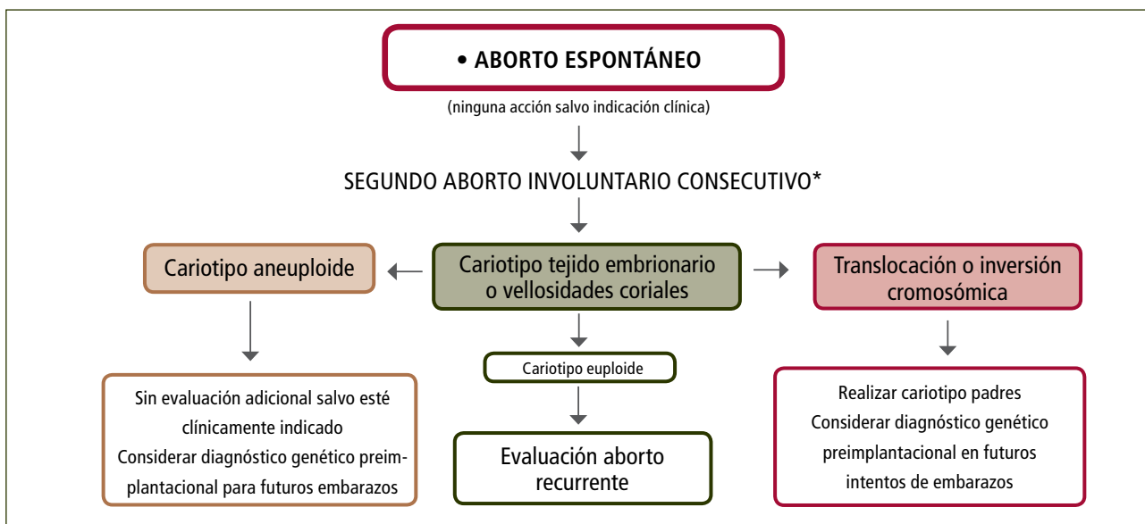
FIGURA 1. EVALUACIÓN CITOGENÉTICA DE ABORTOS

Aborto Involuntario de un embarazo clínico documentado mediante ecografía o examen histopatológico figura 1, Diagrama de flujo para la evaluación citogenética de los abortos. Modificado de referencia.