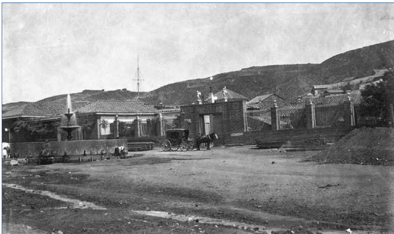
Figura 2. Hospital San Juan de Dios de Valparaíso. 1863.

ció en Mendoza el 3 de diciembre de 1810. Tiempo de levantamientos de las distintas naciones sudamericanas, Mendoza jugó un papel importante en la independencia de Argentina, pero también sufrió una larga serie de batallas entre las distintas facciones de los caudillos que luchaban por la independencia primero y por la manera de gobernarse a sí mismos después.