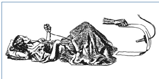
Figura 1. Perineómetro de Kegel.

Fue Arnold Kegel en los años 50, quien describe por primera vez los ejercicios del piso pelviano como tratamiento de la incontinencia urinaria, diseñando además un perineómetro para evaluarlos (4). Estos ejercicios, conocidos como ejercicios de Kegel, conforman la base histórica sobre la cual se desarrolla lo que hoy conocemos como reeducación pelvipérea (RPP) (Figura 1).